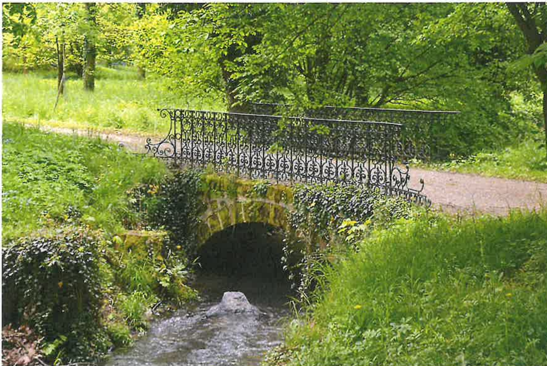
Obr. 1. Předmětný úsek (ozn. SO1) s neobnovenou výsadbou dvou kompozičně původních dřevin.