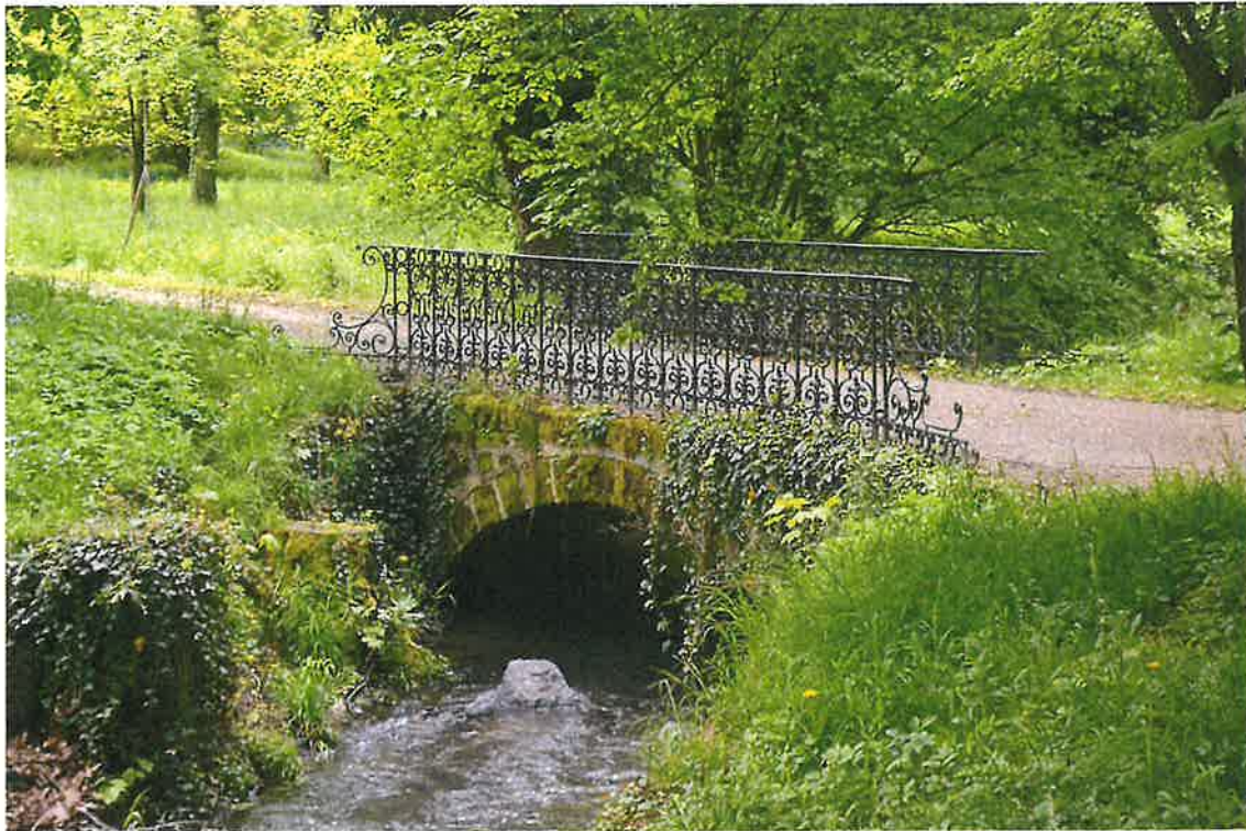
Obr. 1. Předmětný úsek (ozn. SO1) s neobnovenou výsadbou dvou kompozičně původních dřevin.

Zámecká zahrada svou rozlohou 42,69 ha patří k největším zámeckým zahradám v regionu. Stěžejním kompozičním prvkem je Podolský potok, který překonává soubor cenných mostů.